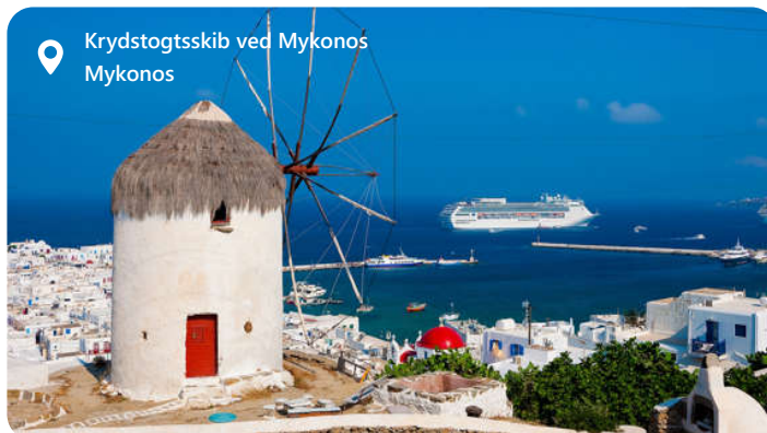
Krydstogtskib ved Mykonos Mykonos

Mykonos, perlen i Det Ægæiske Hav, byder besøgende velkommen med sit maleriske ø-landskab og krystalklare farvande. Denne græske ø er kendt for sine charmerende hvide bygninger med blå kupler, snoede gader og livlige natteliv. Udforsk lokale seværdigheder som det ikoniske Petros of Mykonos og vindmøllerne i Mykonos Town. Nyd autentisk græsk mad med retter som moussaka og souvlaki. Mykonos inviterer dig til at fordype dig i det græske ø-liv og nyde paradiset ved Det Ægæiske Hav.