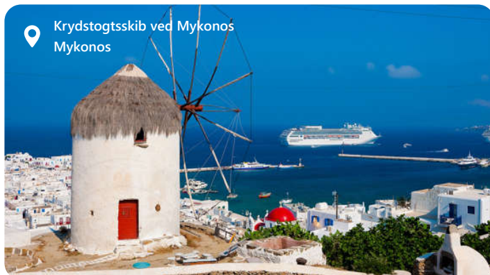
Krydstogtskib ved Mykonos Mykonos

Mykonos, perlen i Det Ægæiske Hav, byder besøgende velkommen med sit maleriske ø-landskab og krystalklare farvande. Denne græske ø er kendt for sine charmerende hvide bygninger med blå kupler, snoede gader og livlige natteliv. Udforsk lokale seværdigheder som det ikoniske Petros of Mykonos og vindmøllerne i Mykonos Town. Nyd autentisk græsk mad med retter som moussaka og souvlaki. Mykonos inviterer dig til at fordype dig i det græske ø-liv og nyde paradiset ved Det Ægæiske Hav.