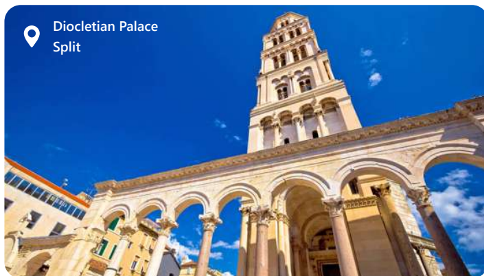
Diocletian Palace Split

Split, er en pragtfuld kroatisk by ved Adriaterhavet og den næststørste by i Kroatien. Med sin rigdom af historie og kultur er Split et fascinerende sted at udforske. Byen er berømt for Diocletians Palads, der stammer tilbage til det 4. århundrede, og som nu er en del af UNESCOs verdensarvliste. Ud over sin historiske betydning byder Split på smukke strande, livlige markeder og en mangfoldig gastronomisk scene. Gå gennem de smalle brostensbelagte gader, udforsk de gamle bymure og nyd den lokale gæstfrihed, der gør Split til et skønt rejsemål ved Adriaterhavet.