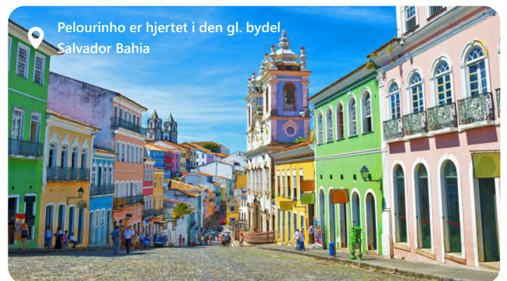
Pelourinho er hjertet i den gl. bydel Salvador Bahia

Salvador, en smuk by i det nordøstlige Brasilien, er en skatkiste af kulturel rigdom og naturskønhed. Byen er ideel for rejsende, der ønsker at udforske den autentiske brasilianske kultur og historie. Salvador byder på en blanding af afrikansk, portugisisk og indiansk kultur, der afspejles i dens musik, dans og kulinariske traditioner. Udforsk de farverige gader i det historiske Pelourinho-kvarter, nyd de vidunderlige strande og oplev den livlige musikscene, der inkluderer den verdensberømte sambastil. Salvador er stedet for en uforglemmelig kulturel rejse og autentisk brasiliansk oplevelse.