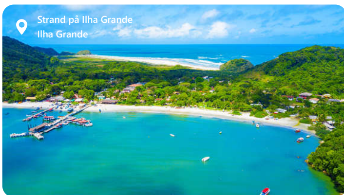
Strand på Ilha Grande Ilha Grande