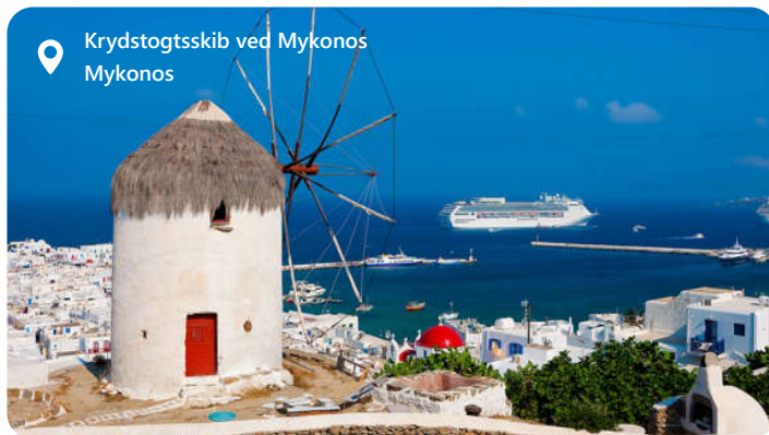
Krydstogtskib ved Mykonos Mykonos

Mykonos, perlen i Det Ægæiske Hav, byder besøgende velkommen med sit maleriske ø-landskab og krystalklare farvande. Denne græske ø er kendt for sine charmerende hvide bygninger med blå kupler, snoede gader og livlige natteliv. Udforsk lokale seværdigheder som det ikoniske Petros of Mykonos og vindmøllerne i Mykonos Town. Nyd autentisk græsk mad med retter som moussaka og souvlaki. Mykonos inviterer dig til at fordype dig i det græske ø-liv og nyde paradiset ved Det Ægæiske Hav.