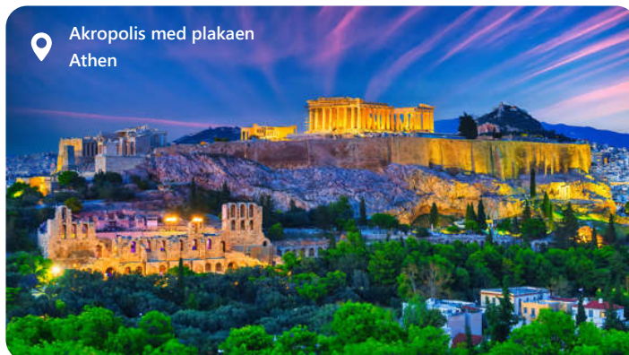
Akropolis med plakaen Athen

Krydstogtshavnen hedder Pireus. Herfra er der 12 km til Grækenlands hovedstad. Landets historiske hjerte, er en by fyldt med antikke skatte og en levende kulturarv. Fra Akropolis' majestætiske ruiner til det livlige Plaka-kvarter, tilbyder Athen en blanding af gamle og moderne oplevelser. Udforsk verdensberømte museer som Det Nationale Arkæologiske Museum og smag på autentisk græsk mad i lokale taverner. Byens sjæl pulserer med historie, og dens gæstfrihed er uovertruffen.