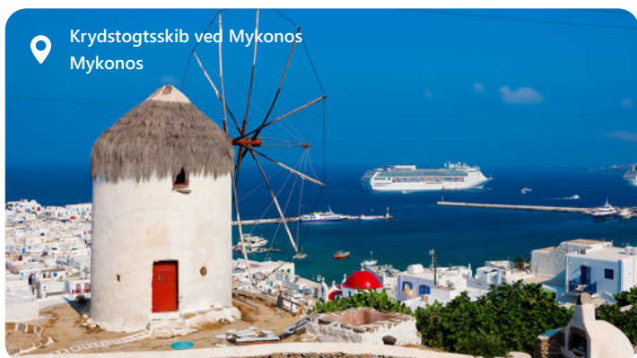
Krydstogtskib ved Mykonos Mykonos