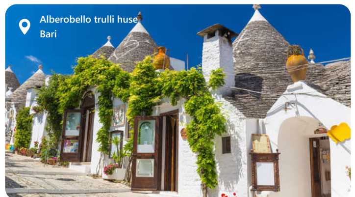
Alberobello trulli huse Bari

Bari er hovedstaden i regionen Puglia og er smukt placeret ved Adriaterhavskysten i det sydlige Italien, med en lang og rig historie, der går tilbage til antikken. Bari's gamle bydel, kendt som "Bari Vecchia," er fyldt med smalle gader, historiske bygninger og kirker. Byens gader er fyldt med hyggelige restauranter og trattoriaer. Havnen er vigtig og forbinder byen med andre destinationer i Middelhavet og er en gateway til øerne i Adriaterhavet.