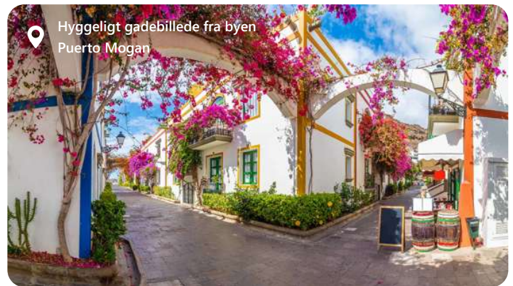
Hyggeligt gadebillede fra byen Puerto Mogan

Las Palmas, hovedstaden på Gran Canaria i Spanien, byder besøgende velkommen med sin solrige atmosfære og kulturelle mangfoldighed. Byen er kendt for sine smukke strande, inklusive Playa de Las Canteras, og en række kulturelle begivenheder og festivaler. Udforsk de lokale kulturelle perler som Casa de Colón og Catedral de Santa Ana, og nyd autentiske kanariske kulinariske oplevelser med lokale retter og vine. Las Palmas tilbyder en harmonisk blanding af sol og kultur, hvilket gør den til en ideel destination for dem, der ønsker at udforske Gran Canarias naturskønhed og rige kulturarv.