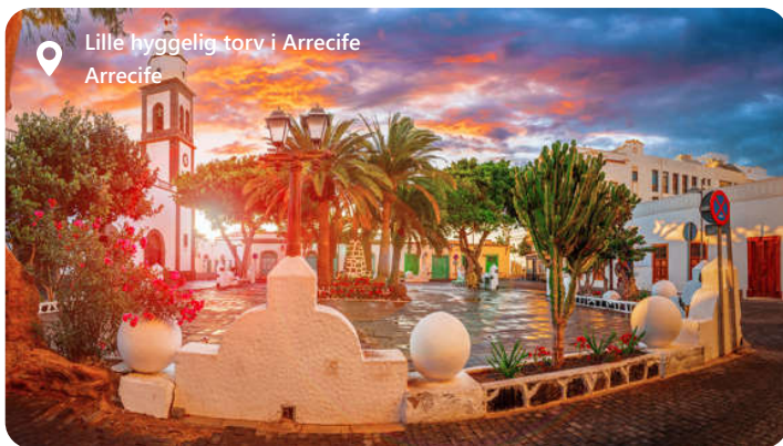
Lille hyggelig torv i Arrecife Arrecife