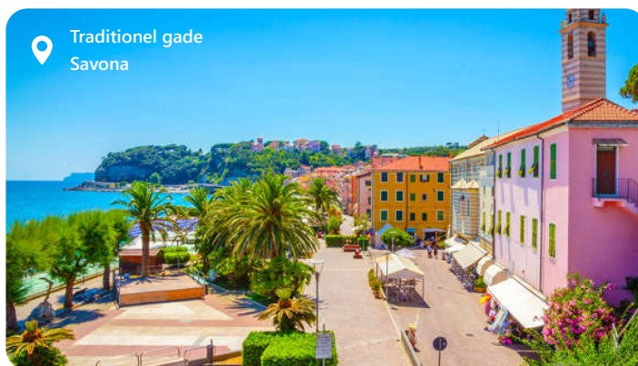
Traditionel gade Savona

Savona byder dig velkommen med sin skønhed og historiske charme. Byen er Costa Cruises base, og derfor kommer mange af deres skibe også i land her. Savona er en destination, der byder på solrige strande og en gammel bydel der er fyldt med smalle gader og fascinerende arkitektoniske perler. Nyd de lækre italienske retter på lokale restauranter, og oplev den varme og gæstfri atmosfære i denne fantastiske by. Ikke langt fra Savona er der et rigt udbud af oplevelser. For de eventyrlystne er der inde i baglandet Via Ferrata degli Artisti. Hele kyststrækningen kaldes Ligurien og byder på fortryllende små åndehuller. Men mest af alt er det vær at opleve de 5 små kystbyer ved Cinque Terre.