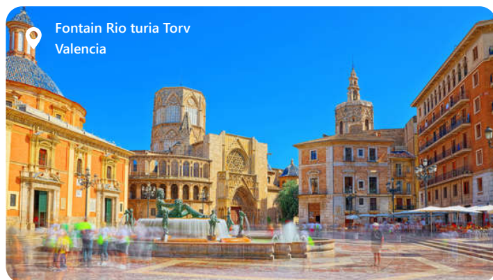
Fontain Rio turia Torv Valencia

Valencia er en smuk region beliggende på den østlige kyst af Spanien, er en skatkiste af historie, kultur og naturskønhed. Med sin fascinerende blanding af middelalderlige monumenter, moderne arkitektur og strålende strande er Valencia en magnet for rejsende fra hele verden. Hjemsted for den berømte paella-ret, byder regionen på en udsøgt kulinarisk oplevelse. Den årlige Las Fallas-festival er et imponerende skue med farverige optog og spektakulære fyrværkeri. Valencia er også kendt for sin arkitektoniske perle, City of Arts and Sciences. Dette sted er et paradys for kunst- og videnskabsentusiaster. Valencia er kort sagt en destination, der fusionerer fortidens pragt med nutidens dynamik og naturens skønhed.