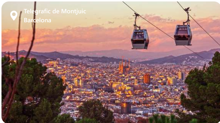
Telegrafic de Montjuic Barcelona