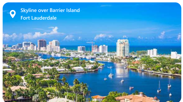
Skyline over Barrier Island Fort Lauderdale

Fort Lauderdale, ofte omtalt som "Venedig i Amerika" på grund af sine mange kanaler og vandveje, er en solrig perle i den sydlige del af Florida, tæt på Miami. Byen er kendt for sine betagende strande, luksuriøse feriesteder og pulserende natteliv. Fort Lauderdale tiltrækker besøgende med sine blide klima og utallige udendørsaktiviteter, herunder sejlsport og vandsport i det krystallklare Atlanterhav. Den charmerende Las Olas Boulevard byder på shopping og spisning i verdensklasse. Fort Lauderdale er også en vigtig krydstogthavn og et ideelt udgangspunkt for at udforske det sydlige Florida, herunder Miami, Everglades og de tropiske nøgleøer.