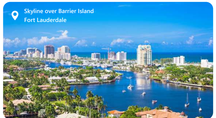
Skyline over Barrier Island Fort Lauderdale

Fort Lauderdale, ofte omtalt som "Venedig i Amerika" på grund af sine mange kanaler og vandveje, er en solrig perle i den sydlige del af Florida, tæt på Miami. Byen er kendt for sine betagende strande, luksuriøse feriesteder og pulserende natteliv. Fort Lauderdale tiltrækker besøgende med sine blide klima og utallige udendørsaktiviteter, herunder sejlsport og vandsport i det krystallklare Atlanterhav. Den charmerende Las Olas Boulevard byder på shopping og spisning i verdensklasse. Fort Lauderdale er også en vigtig krydstogthavn og et ideelt udgangspunkt for at udforske det sydlige Florida, herunder Miami, Everglades og de tropiske nøgleøer.