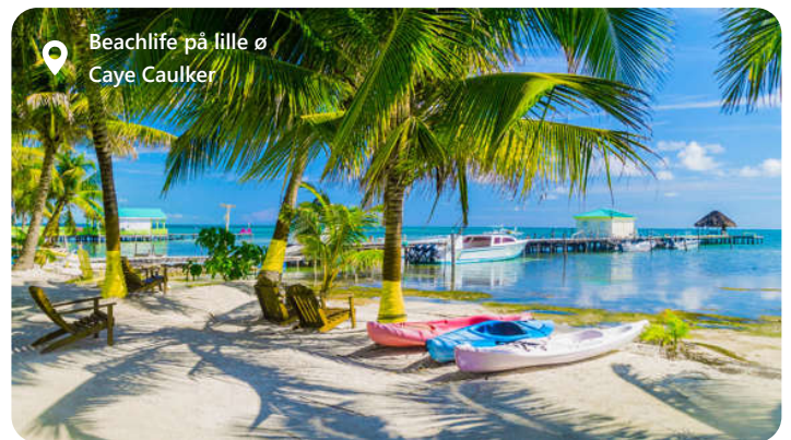
Beachlife på lille ø Caye Caulker

Hovedstaden Belize er ofte et lidt rodet bekendtskab. Byen er ikke så spændende, men man skal ikke langt fra havnen før det ser helt anderledes ud. Her er Belize kendt for sin naturskønhed og forskelligartede økosystemer. Landets kystlinje langs Caribien er hjemsted for regnskove, mangroveskove, koraller og kalkstensgrotter. Der er en mangfoldig kultur, som afspejles i landets musik, dans, mad og kunst. En halv times sejlads fra centrum ligger paradiset i bogstaveligste forstand. Tag både og nyd dage på Caye Caulker hvis du er til sol og hygge med billig mad og kulørte drinks.