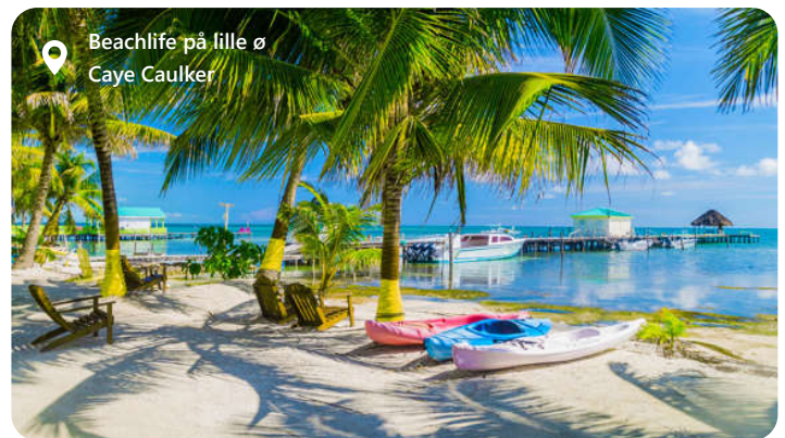
Beachlife på lille ø Caye Caulker

Hovedstaden Belize er ofte et lidt rodet bekendtskab. Byen er ikke så spændende, men man skal ikke langt fra havnen før det ser helt anderledes ud. Her er Belize kendt for sin naturskønhed og forskelligartede økosystemer. Landets kystlinje langs Caribien er hjemsted for regnskove, mangroveskove, koraller og kalkstensgrotter. Der er en mangfoldig kultur, som afspejles i landets musik, dans, mad og kunst. En halv times sejlads fra centrum ligger paradiset i bogstaveligste forstand. Tag både og nyd dage på Caye Caulker hvis du er til sol og hygge med billig mad og kulørte drinks.