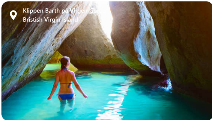
Klippen Barth på Virgin Gorda British Virgin Island