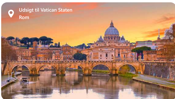
Udsigt til Vatican Staten Rom