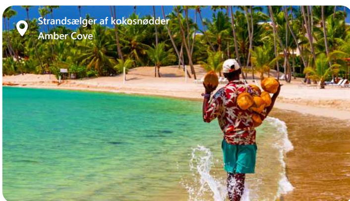
Strandsælger af kokosnødder Amber Cove

byder området også på smukke strande, fiskemuligheder og rekreative aktiviteter. Besøgende kan udforske en spændende blanding af rumfarts- og maritime kulturer og nyde solen, sandet og havnelivet i Port Canaveral.