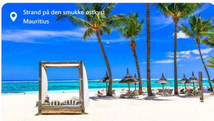
Strand på den smukke østkyst Mauritius