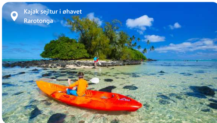
Kajak sejltur i øhavet Rarotonga

Rarotonga, den største ø i Cookøerne, er en sand perle i det sydlige Stillehav. Med sit krystallklare hav, bløde sandstrande og frodige landskaber er Rarotonga et tropisk paradys for rejsende. Udforsk øens naturskønhed ved at vandre i det bjergrige terræn, snorkle i farverige koralrev og slappe af på de billedskønne strande. Den afslappede atmosfære og den venlige lokalbefolkning gør det til det ideelle sted at koble af og genopdage roen. Nyd den lokale kultur og prøv de lækre retter. Rarotonga byder på ægte sydhavsoplevelser i et tropisk paradys.