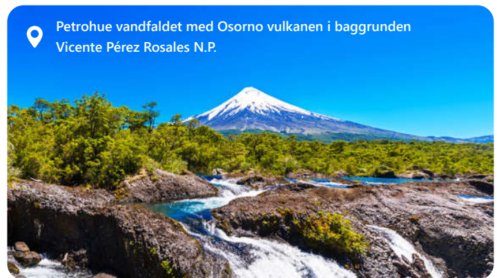
Petrohue vandfaldet med Osorno vulkanen i baggrunden Vicente Pérez Rosales N.P.

Omgivet af imponerende vulkanske landskaber, dybe fjorde og det krystallklare Stillehav, tilbyder byen en perfekt blanding af naturskønhed og kulturel rigdom. Med sin fiskerihavn, farverige huse og velsmagende skaldyrsretter er Puerto Montt et populært rejsemål for dem, der ønsker at udforske Chiles unikke sydlige region. Byen er også en vigtig gateway til det berømte Patagonien og øerne i det chilenske fjordsystem, hvilket gør den til et ideelt udgangspunkt for eventyrlystne rejsende.