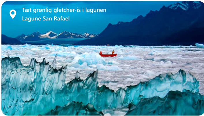
Tæt grønlig gletcher-is i lagunen Lagune San Rafael