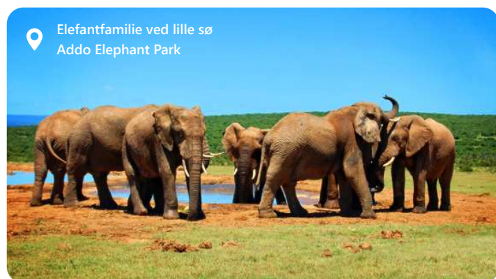
📍 Elefantfamilie ved lille sø Addo Elephant Park