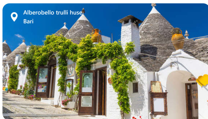
Alberobello trulli huse Bari

Bari er hovedstaden i regionen Puglia og er smukt placeret ved Adriaterhavskysten i det sydlige Italien, med en lang og rig historie, der går tilbage til antikken. Bari's gamle bydel, kendt som "Bari Vecchia," er fyldt med smalle gader, historiske bygninger og kirker. Byens gader er fyldt med hyggelige restauranter og trattoriaer. Havnen er vigtig og forbinder byen med andre destinationer i Middelhavet og er en gateway til øerne i Adriaterhavet.