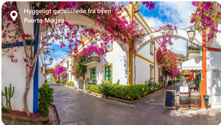
Hyggeligt gadebillede fra byen Puerto Mogan