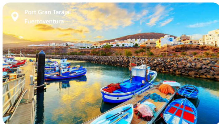
Port Gran Tarajal Fuerteventura

Fuerteventura er en perle i De Kanariske Øer, er et paradys for sol- og strandelskere. Beliggende ud for Afrikas kyst, byder denne spanske ø på betagende strande med gyldent sand og krystallklart vand. Fuerteventura er kendt for sine uendelige strækninger af kystlinje, perfekte til windsurfing, kitesurfing og andre vandsport. Øens vilde og vulkanske landskab skaber et unikt naturmiljø med muligheder for vandreture og udforskning. Med sin afslappede atmosfære og solrige klima hele året rundt er Fuerteventura en drømmedestination for dem, der ønsker at nyde den naturlige skønhed og det spanske ø-livsstil.