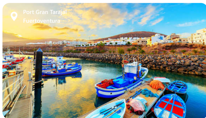
Port Gran Tarajal Fuerteventura

Fuerteventura er en perle i De Kanariske Øer, er et paradys for sol- og strandelskere. Beliggende ud for Afrikas kyst, byder denne spanske ø på betagende strande med gyldent sand og krystallklart vand. Fuerteventura er kendt for sine uendelige strækninger af kystlinje, perfekte til windsurfing, kitesurfing og andre vandsport. Øens vilde og vulkanske landskab skaber et unikt naturmiljø med muligheder for vandreture og udforskning. Med sin afslappede atmosfære og solrige klima hele året rundt er Fuerteventura en drømmedestination for dem, der ønsker at nyde den naturlige skønhed og det spanske ø-livsstil.