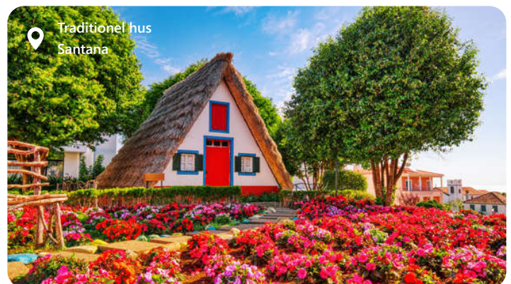
Traditionel hus Santana

Madeira er et naturparadis af blomstrende haver, dramatiske bjerglandskaber og imponerende kyststrækninger. Besøgende kan udforske den farverige hovedstad Funchal, vandre ad levadastierne langs bjergsiderne og nyde udsigten fra Cabo Girão, Europas højeste klippeudsigt. Besøgende kan også udforske de spektakulære omgivelser, herunder bjergene og Levada-vandingskanalerne, der er ideelle til vandreture og naturoplevelser. Funchal er en ægte juvel på Madeira, hvor natur og kultur mødes harmonisk.