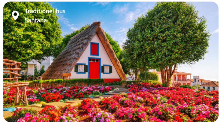
Traditionel hus Santana

Madeira er et naturparadis af blomstrende haver, dramatiske bjerglandskaber og imponerende kyststrækninger. Besøgende kan udforske den farverige hovedstad Funchal, vandre ad levadastierne langs bjergsiderne og nyde udsigten fra Cabo Girão, Europas højeste klippeudsigt. Besøgende kan også udforske de spektakulære omgivelser, herunder bjergene og Levada-vandingskanalerne, der er ideelle til vandreture og naturoplevelser. Funchal er en ægte juvel på Madeira, hvor natur og kultur mødes harmonisk.