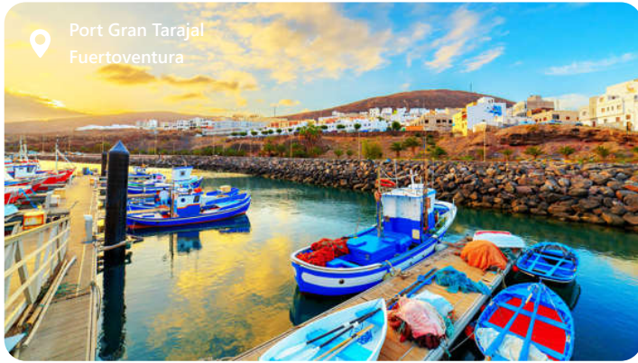
Port Gran Tarajal Fuerteventura