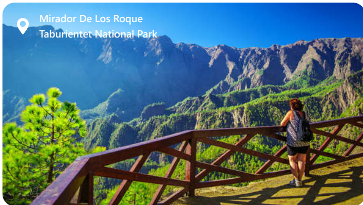
Mirador De Los Roque Taburientet National Park