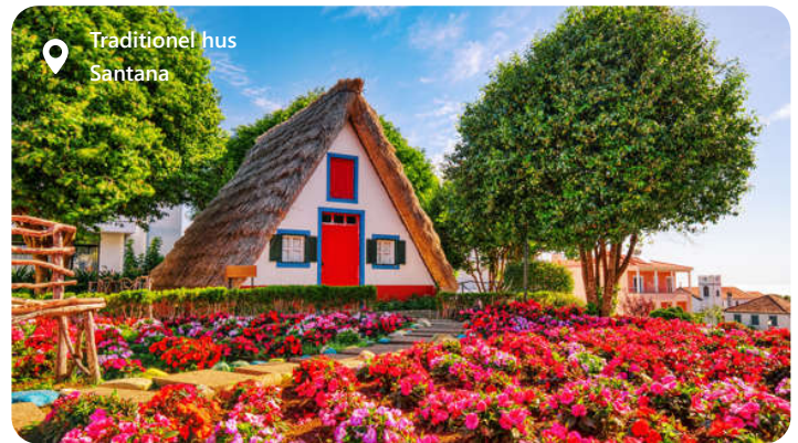
Traditionel hus Santana

Madeira er et naturparadis af blomstrende haver, dramatiske bjerglandskaber og imponerende kyststrækninger. Besøgende kan udforske den farverige hovedstad Funchal, vandre ad levadastierne langs bjergsiderne og nyde udsigten fra Cabo Girão, Europas højeste klippeudsigt. Besøgende kan også udforske de spektakulære omgivelser, herunder bjergene og Levada-vandingskanalerne, der er ideelle til vandreture og naturoplevelser. Funchal er en ægte juvel på Madeira, hvor natur og kultur mødes harmonisk.