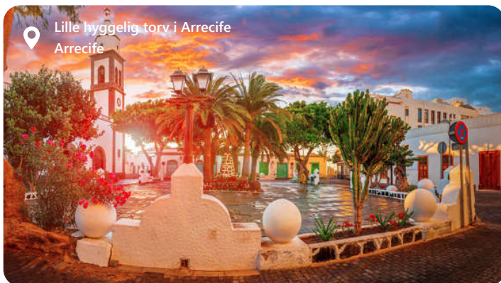
Lille hyggelig torv i Arrecife Arrecife