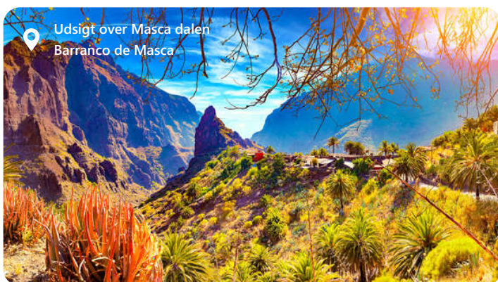
Udsigt over Masca dalen Barranco de Masca