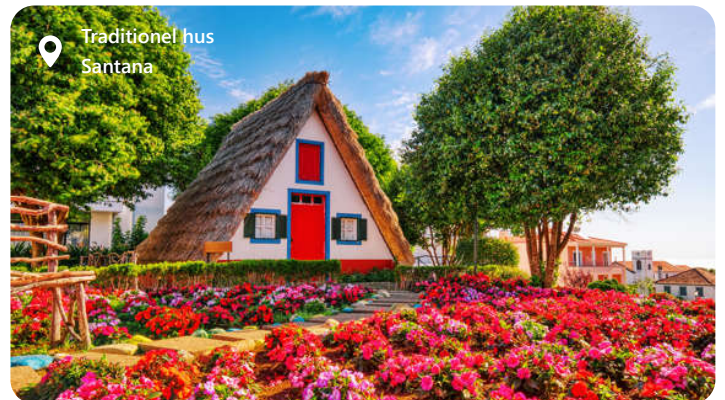
Traditionel hus Santana

Madeira er et naturparadis af blomstrende haver, dramatiske bjerglandskaber og imponerende kyststrækninger. Besøgende kan udforske den farverige hovedstad Funchal, vandre ad levadastierne langs bjergsiderne og nyde udsigten fra Cabo Girão, Europas højeste klippeudsigt. Besøgende kan også udforske de spektakulære omgivelser, herunder bjergene og Levada-vandingskanalerne, der er ideelle til vandreture og naturoplevelser. Funchal er en ægte juvel på Madeira, hvor natur og kultur mødes harmonisk.