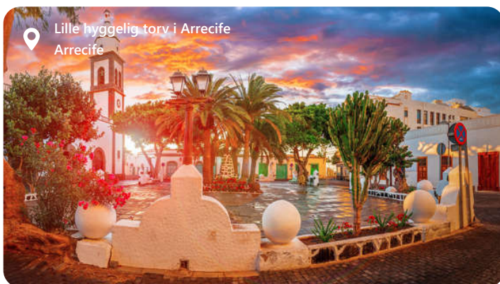
Lille hyggelig torv i Arrecife Arrecife