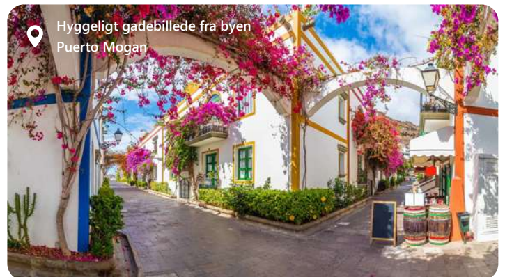
Hyggeligt gadebillede fra byen Puerto Mogan

Las Palmas, hovedstaden på Gran Canaria i Spanien, byder besøgende velkommen med sin solrige atmosfære og kulturelle mangfoldighed. Byen er kendt for sine smukke strande, inklusive Playa de Las Canteras, og en række kulturelle begivenheder og festivaler. Udforsk de lokale kulturelle perler som Casa de Colón og Catedral de Santa Ana, og nyd autentiske kanariske kulinariske oplevelser med lokale retter og vine. Las Palmas tilbyder en harmonisk blanding af sol og kultur, hvilket gør den til en ideel destination for dem, der ønsker at udforske Gran Canarias naturskønhed og rige kulturarv.