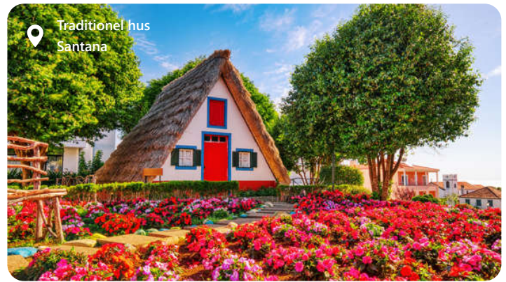
Traditionel hus Santana

Madeira er et naturparadis af blomstrende haver, dramatiske bjerglandskaber og imponerende kyststrækninger. Besøgende kan udforske den farverige hovedstad Funchal, vandre ad levadastierne langs bjergsiderne og nyde udsigten fra Cabo Girão, Europas højeste klippeudsigt. Besøgende kan også udforske de spektakulære omgivelser, herunder bjergene og Levada-vandingskanalerne, der er ideelle til vandreture og naturoplevelser. Funchal er en ægte juvel på Madeira, hvor natur og kultur mødes harmonisk.