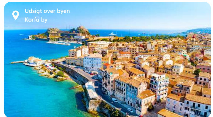
Udsigt over byen Korfu by

Under et Middelhav krydstogt ankommer du til havnen på Korfu, Neo Limani, som ligger få minutters gang fra byens centrum, og derfor et hurtigt hop fra kajen. Indgangen til byen ligger ved foden af den nye fæstning. På dette tidspunkt kan du ved at stoppe ved Korfu vandre rundt i de smalle gader med turistbutikker. Fuldend din rundvisning på øen med total fordybelse i det frodige grønne område: oliventræer, appelsintræer, cypresser samt kulturelle begivenheder i hjertet af den befæstede by er normen!