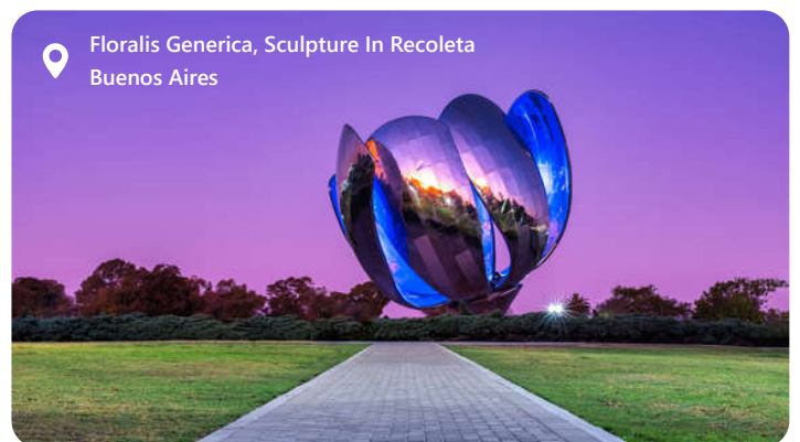
Floralis Genérica, Sculpture In Recoleta Buenos Aires

Buenos Aires, Argentinas hovedstad, er en by fyldt med energi og passion. Den er kendt for sin unikke stil og charme. Som kulturelt centrum i Sydamerika er byen kendt for sin blomstrende kunstscene og er hjemsted for mange verdenskendte kunstnere samt en rig historie, der afspejles i dens arkitektur. Se bl.a. Plaza de Mayo, Casa Rosada (regeringspaladset), og La Recoleta. Gå ikke glip af byens tango-shows og dansehaller, hvor besøgende kan opleve den ikoniske dansearter. Der er fantastisk shopping især på Avenida Florida, hvor du finder alt fra designerbutikker til lokale markeder. Rundt om byen findes smukke naturområder som Reserva Ecológica Costanera Sur og Jardín Botánico Carlos Thays.