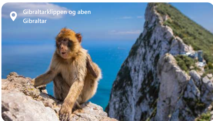
Gibraltarklippen og aben Gibraltar