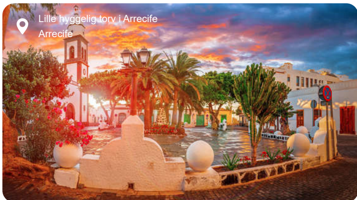
Lille hyggelig torv i Arrecife Arrecife