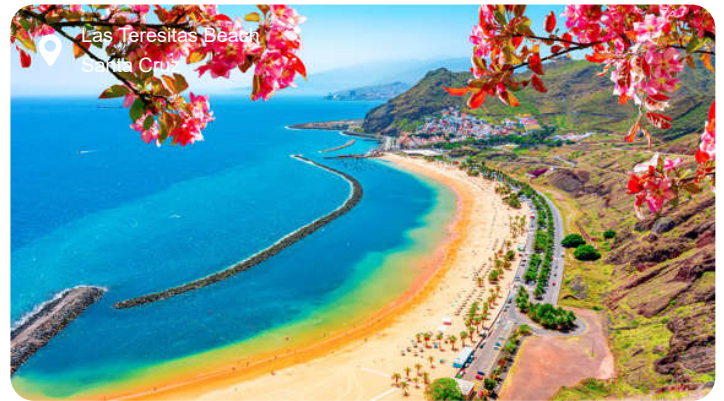
Las Teresitas Beach Santa Cruz

Tenerifes hovedstad hedder Santa Cruz og kan prale af kulørte markeder, blomstrende haver, spændende kunstgallerier og museer samt livlige, udendørs caféer. Øens vartegn er dog den stadig aktive vulkan Teide beliggende i et barsk og goldt men smukt landskab, hvor der ligger sne året rundt. Langs kysterne er naturen mere frodig, især på øens nordside, hvor hyggelige og farverige Puerto de la Cruz er rig på historisk arkitektur med gamle huse med træbalkoner. Her ligger også Loro Parque, hvor papegøjer cykler og pingviner hopper og danser. Og så findes der faktisk også pyramider bygget af lavasten på øen!