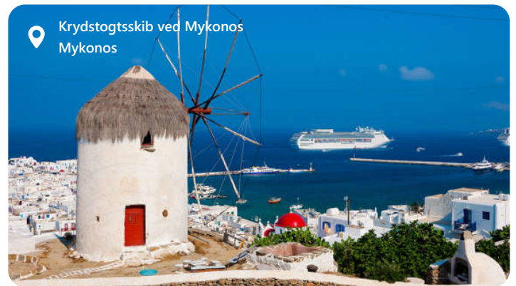
Krydstogtskib ved Mykonos Mykonos

Mykonos, perlen i Det Ægæiske Hav, byder besøgende velkommen med sit maleriske ø-landskab og krystallklare farvande. Denne græske ø er kendt for sine charmerende hvide bygninger med blå kupler, snoede gader og livlige natteliv. Udforsk lokale seværdigheder som det ikoniske Petros of Mykonos og vindmøllerne i Mykonos Town. Nyd autentisk græsk mad med retter som moussaka og souvlaki. Mykonos inviterer dig til at fordype dig i det græske ø-liv og nyde paradiset ved Det Ægæiske Hav.