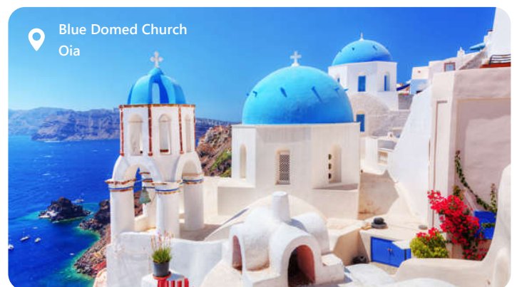
Blue Domed Church Oia

Santorini, en af de mest ikoniske græske øer, er kendt for sin betagende naturskønhed og unikke arkitektur. De karakteristiske hvide bygninger med blå kupler, der kigger ud over det azurblå Ægæiske Hav, skaber et idyllisk og malerisk landskab. Øen har også en rig historie, der kan udforskes i de antikke ruiner, herunder den mytiske by Akrotiri, begravet under vulkansk aske i århundreder. Santorini er berømt for sin storslåede solnedgange, der kan nydes fra byen Oia. Besøgende kan også forkæle sig selv med lækre græske retter og udforske de smukke strande og krystallklart vand. Santorini er en uforglemmelig destination for afslapning og romantik.