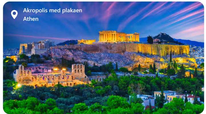
Akropolis med plakaen Athen

Krydstogthavnen hedder Pireus. Herfra er der 12 km til Grækenlands hovedstad. Landets historiske hjerte, er en by fyldt med antikke skatte og en levende kulturarv. Fra Akropolis' majestætiske ruiner til det livlige Plaka-kvarter, tilbyder Athen en blanding af gamle og moderne oplevelser. Udforsk verdensberømte museer som Det Nationale Arkæologiske Museum og smag på autentisk græsk mad i lokale taverner. Byens sjæl pulserer med historie, og dens gæstfrihed er uovertruffen.