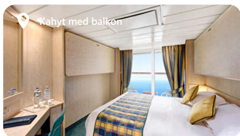
Kahyt med balkon