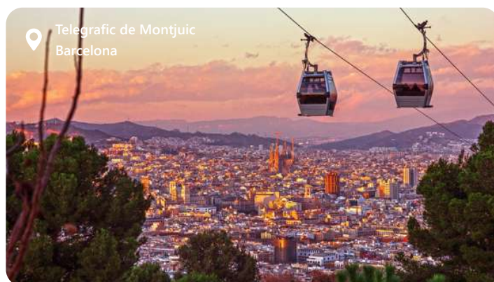
Telegrafic de Montjuïc Barcelona

Barcelona - en charmerende metropol og hovedstad i det katalanske Nordspanien. Byen er en sand perle hvor historie og nutid forenes i perfekt harmoni. Særligt Gaudís fascinerende mesterværker som La Sagrada Família og Park Güell, tager enhver med storm. Byen stråler af kulturel rigdom med kunstgallerier, museer og et livligt gademiljø. De gyldne sandstrande langs kysten og den fortryllende gotiske kvarter skaber en atmosfære, der indfanger hjertet og sindet. Barcelona er ikke blot en by, det er en oplevelse.