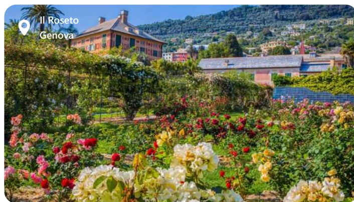
Il Roseto Genova

Genoa er beliggende ved den maleriske Liguriske havkyst i Italien, er en by med en fascinerende historie og kulturel rigdom. Dens gamle havn, en af Middelhavets største, har tjent som et vigtigt knudepunkt for handel i århundreder. Byen er kendt for sin charmerende gamle bydel med smalle brostensbelagte gader, farverige bygninger og imponerende paladser. Genoa er også fødestedet for opdagelsesrejsende Christopher Columbus og byder på et væld af museer, kunstgallerier og en levende kulinarisk scene med lækker ligurisk mad. Med sin unikke blanding af historie, kultur og skønhed er Genoa en uimodståelig destination i Italien.