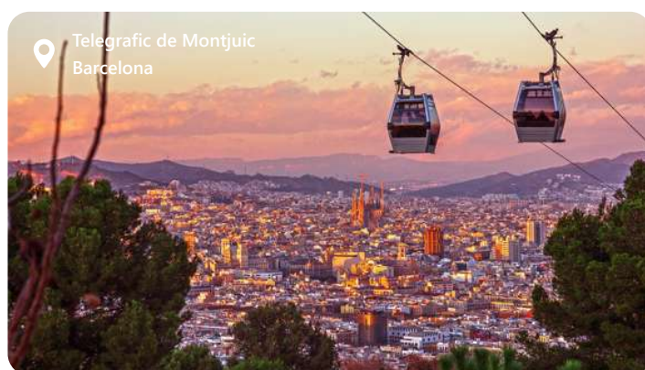
Telegrafic de Montjuic Barcelona

Barcelona - en charmerende metropol og hovedstad i det katalanske Nordspanien. Byen er en sand perle hvor historie og nutid forenes i perfekt harmoni. Særligt Gaudís fascinerende mesterværker som La Sagrada Família og Park Güell, tager enhver med storm. Byen stråler af kulturel rigdom med kunstgallerier, museer og et livligt gademiljø. De gyldne sandstrande langs kysten og den fortryllende gotiske kvarter skaber en atmosfære, der indfanger hjertet og sindet. Barcelona er ikke blot en by, det er en oplevelse.