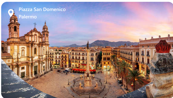
Piazza San Domenico Palermo