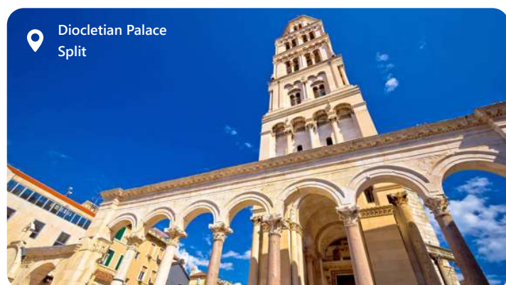
Diocletian Palace Split