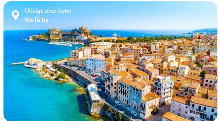
Udsigt over byen Korfu by

Under et Middelhav krydstogt ankommer du til havnen på Korfu, Neo Limani, som ligger få minutters gang fra byens centrum, og derfor et hurtigt hop fra kajen. Indgangen til byen ligger ved foden af den nye fæstning. På dette tidspunkt kan du ved at stoppe ved Korfu vandre rundt i de smalle gader med turistbutikker. Fuldend din rundvisning på øen med total fordybelse i det frodige grønne område: oliventræer, appelsintræer, cypresser samt kulturelle begivenheder i hjertet af den befæstede by er normen!