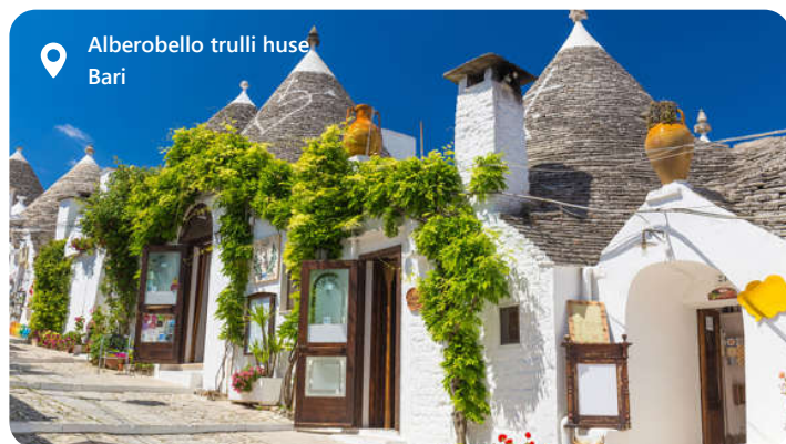
Alberobello trulli huse Bari

Bari er hovedstaden i regionen Puglia og er smukt placeret ved Adriaterhavskysten i det sydlige Italien, med en lang og rig historie, der går tilbage til antikken. Bari's gamle bydel, kendt som "Bari Vecchia," er fyldt med smalle gader, historiske bygninger og kirker. Byens gader er fyldt med hyggelige restauranter og trattoriaer. Havnen er vigtig og forbinder byen med andre destinationer i Middelhavet og er en gateway til øerne i Adriaterhavet.