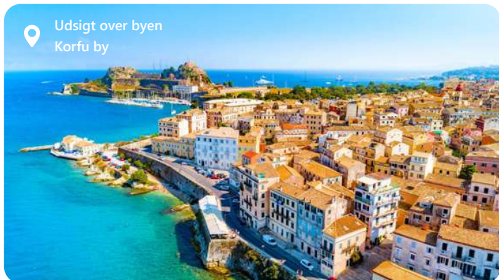
Udsigt over byen Korfu by