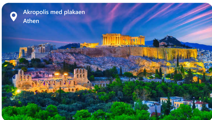
Akropolis med plakaen Athen