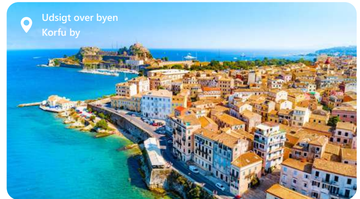
Udsigt over byen Korfu by

Under et Middelhav krydstogt ankommer du til havnen på Korfu, Neo Limani, som ligger få minutters gang fra byens centrum, og derfor et hurtigt hop fra kajen. Indgangen til byen ligger ved foden af den nye fæstning. På dette tidspunkt kan du ved at stoppe ved Korfu vandre rundt i de smalle gader med turistbutikker. Fuldend din rundvisning på øen med total fordybelse i det frodige grønne område: oliventræer, appelsintræer, cypresser samt kulturelle begivenheder i hjertet af den befæstede by er normen!