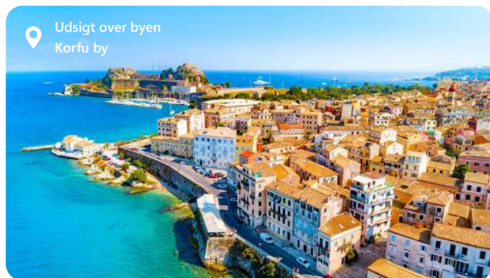
Udsigt over byen Korfu by

Under et Middelhav krydstogt ankommer du til havnen på Korfu, Neo Limani, som ligger få minutters gang fra byens centrum, og derfor et hurtigt hop fra kajen. Indgangen til byen ligger ved foden af den nye fæstning. På dette tidspunkt kan du ved at stoppe ved Korfu vandre rundt i de smalle gader med turistbutikker. Fuldend din rundvisning på øen med total fordybelse i det frodige grønne område: oliventræer, appelsintræer, cypresser samt kulturelle begivenheder i hjertet af den befæstede by er normen!