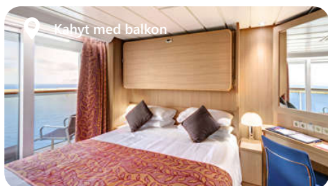
Kahyt med balkon