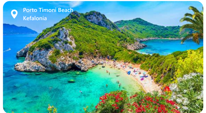
Porto Timoni Beach Kefalonia

Kefalonia er en græsk ø beliggende i Det Ioniske Hav ud for den vestlige kyst af Grækenland. Øen er kendt for sine smukke landskaber, krystallklare farvande og charmerende landsbyer. Den imponerende bjergkæde Ainos dominerer øens indre og giver fantastiske udsigter. Kefalonia tiltrækker besøgende med sine pragtfulde strande, herunder Myrto Beach og Antisamos Beach, samt fascinerende seværdigheder som Drogarati-hulen og Melissani-søen.