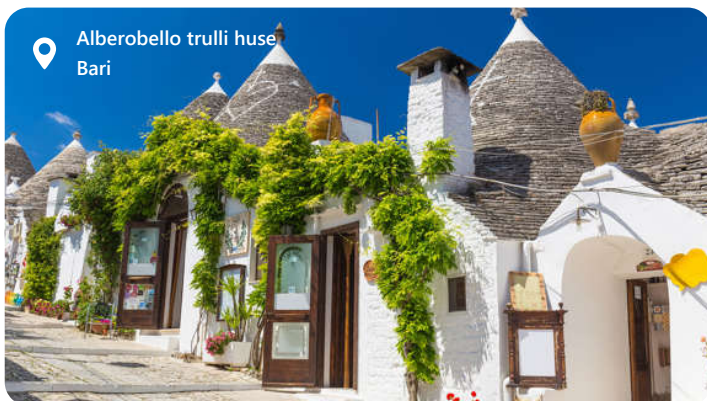
Alberobello trulli huse Bari