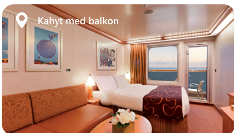
Kahyt med balkon

E1 - Havudsigt E2 - Havudsigt EC - Klassisk Udvendig Med Udsigt EP - Premium Udvendig Med Udsigt EV - Udvendig Garanti Single Oceanview Oceanview Group ( E1 + E2 )