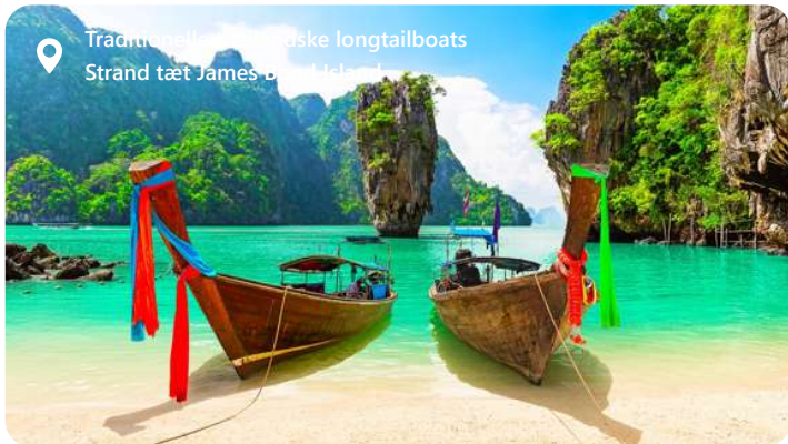
Traditionelle thaiske longtailboats Strand tæt James Bond Island