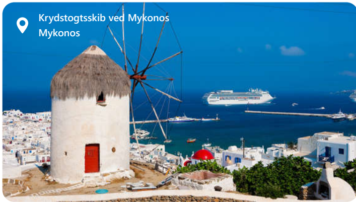
Krydstogtsskib ved Mykonos Mykonos